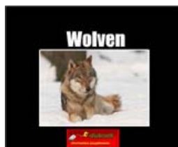
Kast 1: groep 3/4

Wolven hebben niet zo'n goede naam in sprookjes. Hoe zit dat met echte wolven in de natuur? Wat is een roedel? Waarom verdween de wolf uit Nederland? Wat hebben wolven en honden met elkaar te maken?