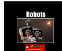
Kast 3: groep 7/8

Nederland is een land met veel water. Er zijn dus veel bruggen. Hoe worden sterke bruggen gemaakt? Welke soorten bruggen zijn er? Ook vertelt dit boek je meer over enkele beroemde bruggen.