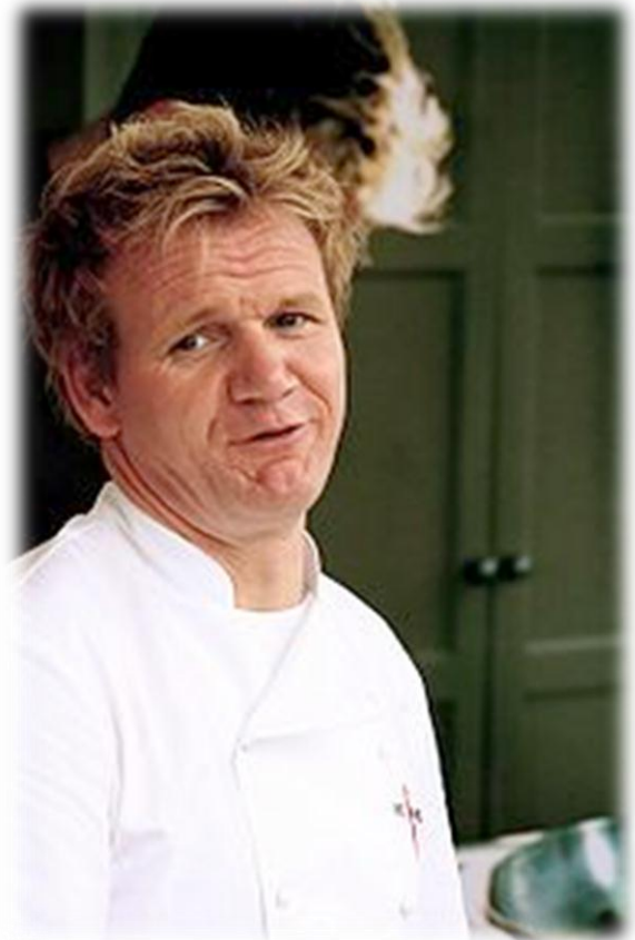
Dit is Gordon Ramsay